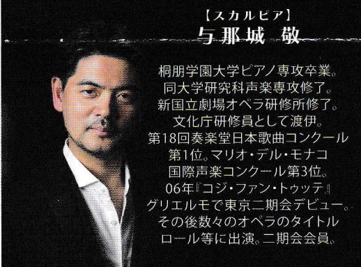
【スカルピア】 与那城 敬

イタリア、ジェノヴァで生まれる。数々の国際コンクールにて優勝。フランコ・ゼッフィレリに見出され『アイーダ』のラダメス役でイタリア全土の劇場でデビューを果たす。その後世界の主要劇場でデビューし、ロンドン、コヴェントガーデンロイヤルオペラでの『トスカ』では、アンジェラ・ゲオルギューとの共演で、空前の大成功を収めている。